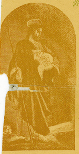
Joh. 10. 14.

Saa kommer jeg og bøier mig, O Jesus, Jesus, ned for dig! Dit Navn, det søde Jesu Navn, Jeg bær' med Kys i Hjertets favn. Dit Navn jeg altid kalder paa, Ihvor jeg skal i Verden gaa, Det er mit Vern, min faste Borg, Der gaar jeg hen i al min Sorg.